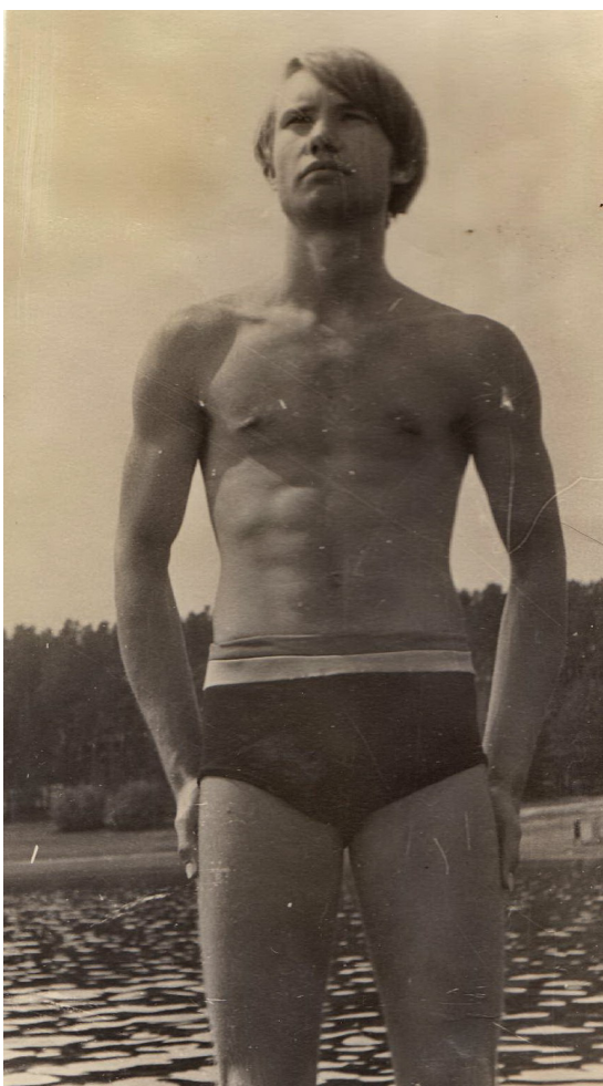
На Шевинском озере

Парень я , вроде , был ничего - не из последних в работе, учебе и спорте.